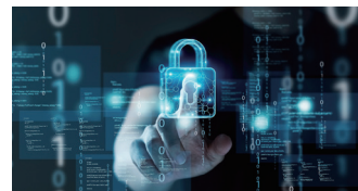
サイバーセキュリティ対策