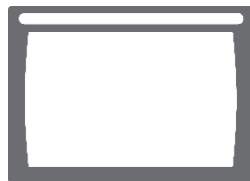
ヒューマン・マシン・ インターフェイス構成