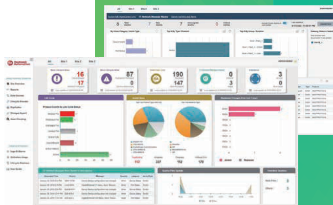
Asset Inventory Manager